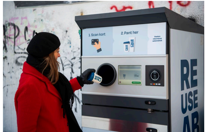
Rücknahmeautomat des Unternehmens TOMRA in Aarhus

Zudem bezieht sich die Mehrwegangebotspflicht aktuell nur auf Gastronomien und deren Lieferservices. Lieferplatt-